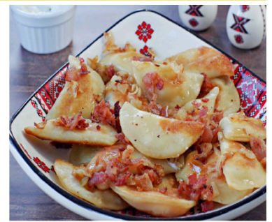
Potato & Cheese Perogies $12 per dozen

To order & arrange pick-up, phone Angie 613 - 410 - 2535