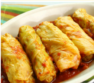
Vegetarian or Meat & Rice Cabbage Rolls (5 per package) $15

All items are cooked & frozen with reheating instructions provided